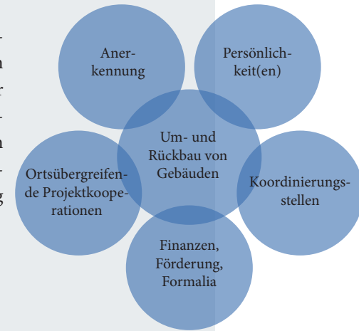
Abb. 1: Themenfelder. (Eigene Darstellung)

Aufbauend auf den allgemeinen Empfehlungen zum Umgang mit Engagementaktivitäten folgen spezielle Handlungsempfehlungen zur Förderung des bürgerschaftlichen Engagements. Die nachfolgenden Empfehlungen behandeln im Wesentlichen sechs Themenfelder, wobei im Zentrum stets die Umnutzung von Gebäuden steht (siehe Abb. 1).