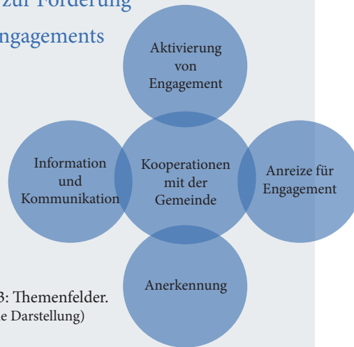
Abb. 3: Themenfelder. (Eigene Darstellung)

Im nachfolgenden Text sind die Empfehlungen zur Förderung des unternehmerischen Engagements zusammengestellt. Abbildung 3 zeigt die dabei behandelten Themenfelder der Empfehlungen in grafischer Form.